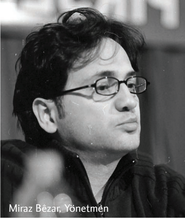
Miraz Bêzar, Yönetmen

Kuzey Irak'tan gelen yönetmen Hisên Hesen Elî ise Kürt sinemasını vatanını, annesini arayan bir sinema olarak anarken bu sinemayı tanımlamada coğrafi im ve imgelerin önemine dikkat çekti.