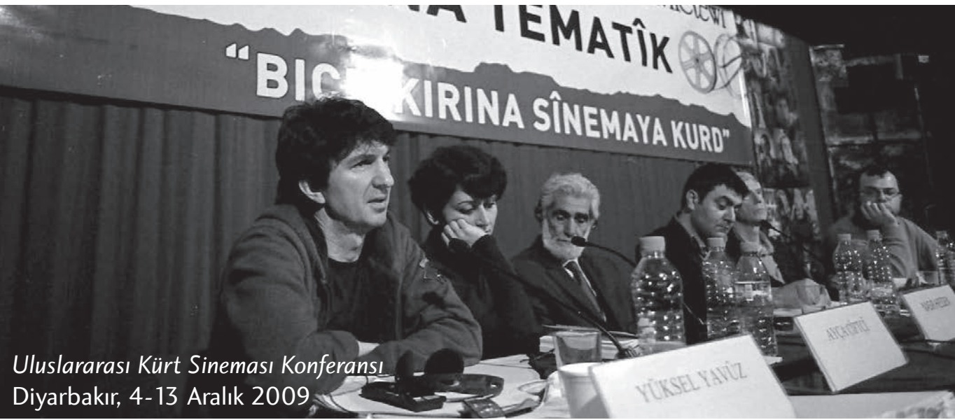
Uluslararası Kürt Sineması Konferansı Diyarbakır, 4-13 Aralık 2009

Otuz senedir süregiden bir savaşın, dört parçaya ayrılmış bir coğrafyanın, dünyanın bir devleti olmayan en büyük mülteci nüfusunun beyazperdeye yansımalarını konuşmak üzere Uluslararası Kürt Sineması Konferansı 'nda toplanmıştık. Varolan bir ulusal sinema mı, yoksa o ulusun ürettiği bir sinema mıydı?